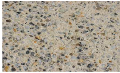
Application du B-REPARA PROTEÇÃO AD 40