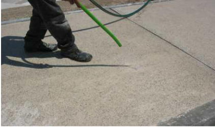
Nettoyage de la surface