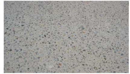
Aspect final de la surface traitée