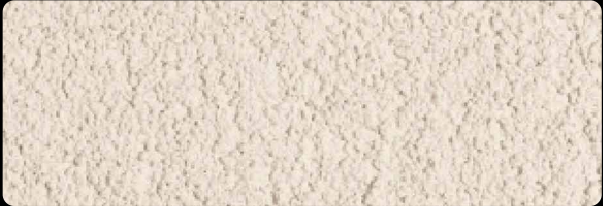
REABILITA CAL AC AREADO

O REABILITA CAL AC permite a obtenção de acabamentos areados finos. Recorrendo a uma técnica de alisamento à costa da colher podem obter-se texturas afagadas. Por sua vez o REABILITA CAL AC FINO promove uma textura lisa.