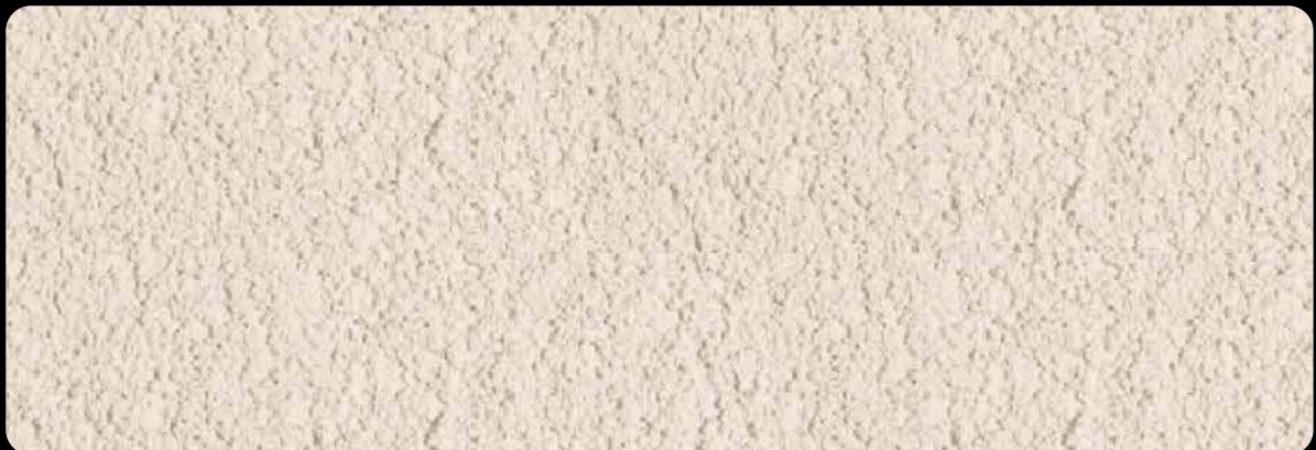
REABILITA CAL AC AFAGADO