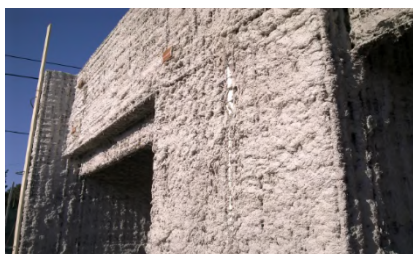
Processo de talochamento