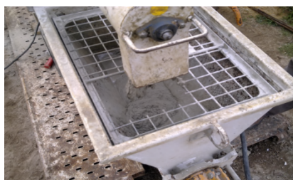
Amassadura do BETÃO-S PROJ 30