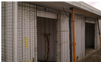
Preparação do suporte