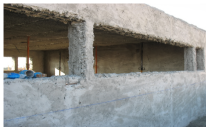
Execução da textura areada